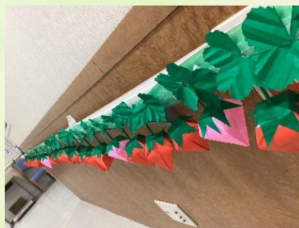
いちご狩りイベント