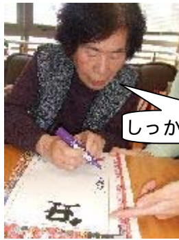
しっかり紙を押さえてね

新しい年がスタートしたので、ご利用者の皆様に気分も新たに今年の目標を書いていただきました。皆様、名前はスラスラと書かれるのですが、今年の抱負は何を書こうかと真剣に考えておられました。「最近筆を持つこともないからね」と、下敷きに使っていた新聞紙に下書きをし、一文字一文字でいねいに確かめながら書き上げてくださいました。 「今年も元気でいられますように」「今年もみんなと仲良くできますように」といった内容が多くありました。本当にそう思います。平成21年も良い年になるといいですね。今年もどうぞよろしくお願いいたします。