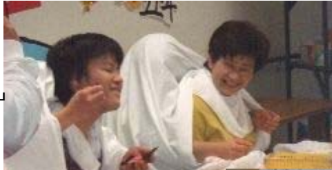
二人羽織 ▶ 「私ってきれい?」 (左は男性職員)

おやつは白玉の入ったおいしいぜんざいで温まり、最後におみくじで今年の運を試しました。今年も元気に笑って、福を招きましょう!