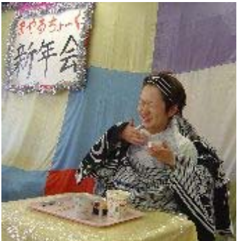
二人羽織できれいに変身!