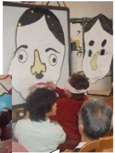
もっと右!そこそこ!