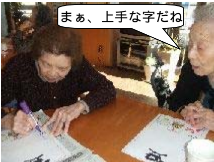
まあ、上手な字だね

新しい年がスタートしたので、ご利用者の皆様に気分も新たに今年の目標を書いていただきました。皆様、名前はスラスラと書かれるのですが、今年の抱負は何を書こうかと真剣に考えておられました。「最近筆を持つこともないからね」と、下敷きに使っていた新聞紙に下書きをし、一文字一文字でいねいに確かめながら書き上げてくださいました。 「今年も元気でいられますように」「今年もみんなと仲良くできますように」といった内容が多くありました。本当にそう思います。平成21年も良い年になるといいですね。今年もどうぞよろしくお願いいたします。