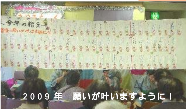
2009年 願いが叶いますように!