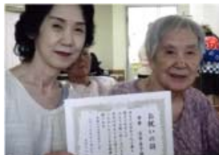
ご家族と一緒にイイ笑顔