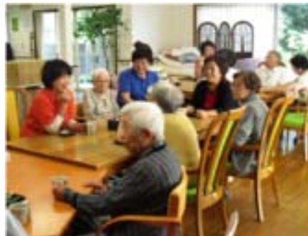
みなさん楽しくおしゃべりタイム

紙芝居サークル「陽だまり」...市内の保育園や小学校、高齢者施設などで読み聞かせなども行っている。資料集めから脚本作り、イラスト作成はメンバー6人で構成し、地域の昔話を知ってもらい地域の魅力を伝えている。