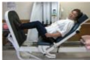
こんなマシンもあるよ