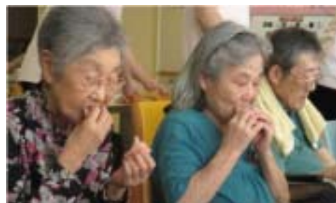
紅白まんじゅう美味しい