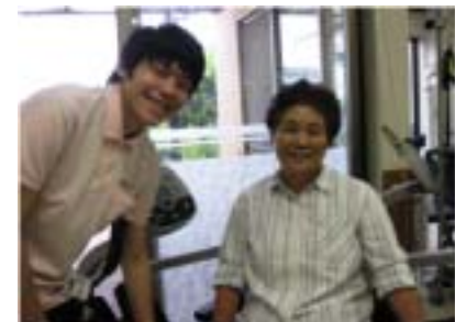
すてっぴは楽しいよ