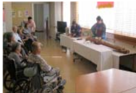
楽しく歌いましょう

今年卒寿を迎えられた利用者様もいらっしゃり、表彰状をお渡しすると、「これでもうしばらく長生き出来ます」「これからも頑張ります」と元気よくお話ししてくださいました。お抹茶は皆さん慣れた手つきで召し上がり、「琴を聞きながらいただくより美味しいね」「結構なお味です。ありがとう」などうれしい感想をいただきました。いつもとは違う神秘的な空間に皆さん感動してくださいました。