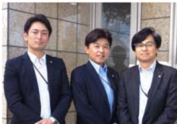
ダイワマン・スーツチーム

みなさん仲が良く、みなさんが家族のような温かいイメージのする法人さんに思いました。これも院長、副院長先生がスタッフの方々と一緒になって、運営されているからだと思いました。(末広・東)