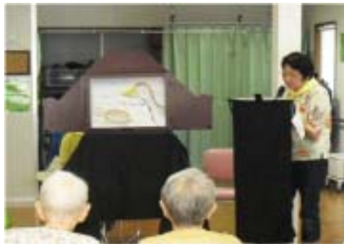
紙芝居、懐かしいですね