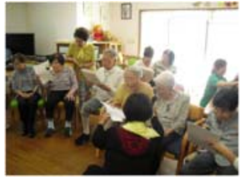
楽しく歌いましょう