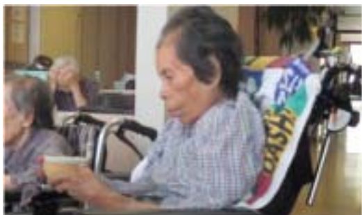
お抹茶なんて久しぶり!!