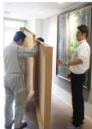
大きな絵画も頑張って運んでくれました

物件案内で良い物件がなかった事も大変でしたが、特に定例会ではとても勉強させていただきました。毎週木曜日になると『あすかデー』と気合が入りました!!! 嬉しかった事は、打合せを重ねていき良い案やプランなどが出来た時は嬉しかったです。そして最終建物竣工を迎えられて、営業冥利につきますと思います!!!! (新宅)