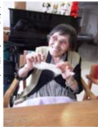
何ができるかお楽しみ

「幼いころ、姉が棒編みをしているのを見て、編み物を始めるようになったのよ。ただ、好きだけ。習ったことはないの。自分流に編んでるだけなの」とおっしゃいますが、作品はプロ並み!!