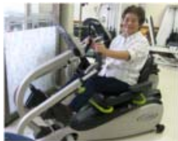
コツコツ続けてきたんよ

紙芝居サークル「陽だまり」...市内の保育園や小学校、高齢者施設などで読み聞かせなども行っている。資料集めから脚本作り、イラスト作成はメンバー6人で構成し、地域の昔話を知ってもらい地域の魅力を伝えている。