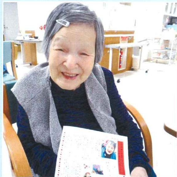
ショートみどりい

誕生日当日、ご自分が掲載された通信記事を見ての1コマです。とても喜んでいただきました。