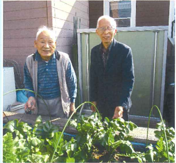
しゅりあちよーく

“しゅりあの畑を輝かそう”と経験豊富な利用者様の手にかかると、みるみるうちに輝きを増していきました。「わたらの手にかかったら、早いよ！」とキラキラとした表情が見てわかります。