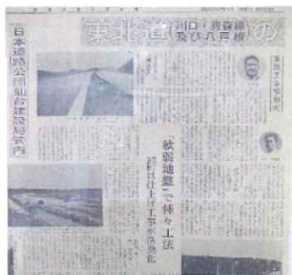
東海道開通建設中の時の記事★