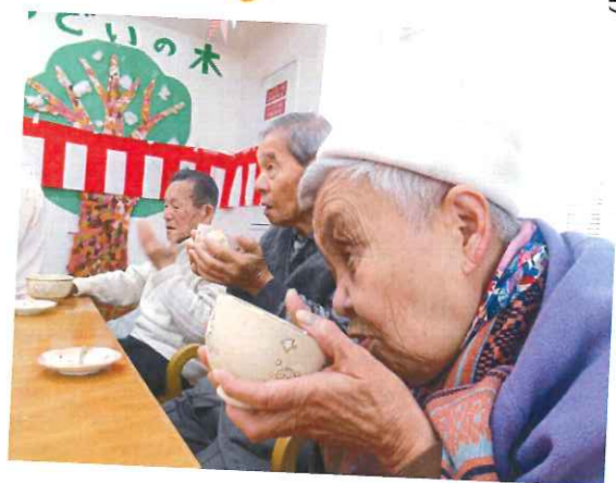
お味はどうでしょう