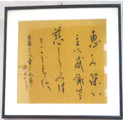
素敵な書の作品たち