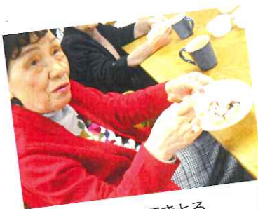
いい感じにできとる でしょ～