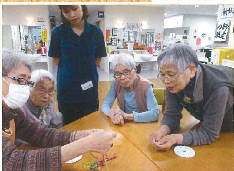
みんなで手順確認中◎

手芸では月に2回(第2・4水曜日14:00~15:00)の時間に、5~6名の利用者の方とボランティアの方3名と一緒に活動をしています。今回は刺繍糸を使用して「組み紐」を作っています。最終的には素敵な「ミサンガ」になる予定です。