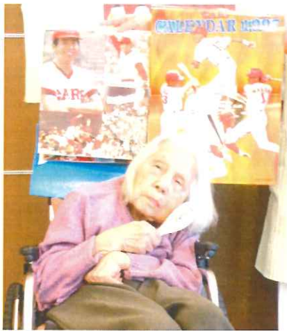
輝かしい黄金期の カレンダーをバックに しゃもじを持って ハイポーズ☆

旦那さんとよくカープの試合を観に行っていたそうです。試合後には息子さんたちに連絡し、迎えにきてもらう事もあったそうです。また、カープの記事が載っている新聞は切り抜いて保管していたそうです。そして、自宅には今もたくさんのカープグッズがあるという生粋ぶり。今回は息子さんにその一部を持ってきていただきました！