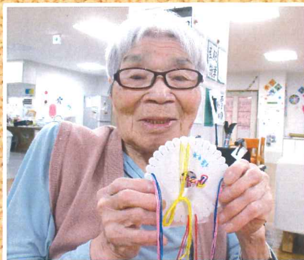
これを使って「組み紐」作り始めます