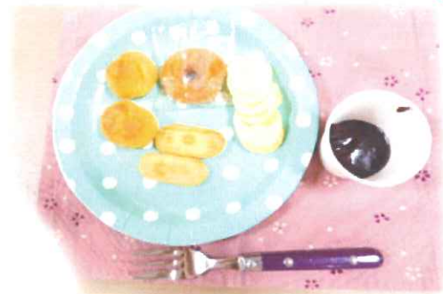
『ハッピーターン』意外と好評でした