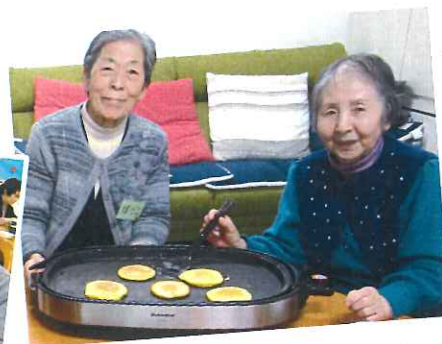
美味しいパンケーキ作るわよ!!