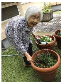
植物のお世話は毎日の日課よ