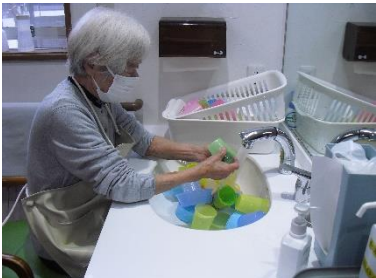
コップ洗い「これくらいはやるよー！」