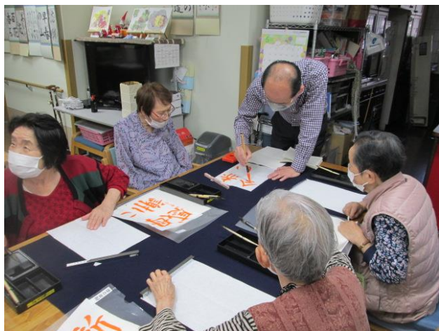
先生がお手本を書いてくださいます