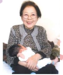
お若い頃の中村さん

「ご本人様のお話と娘様にお話を聞かせてもらい、今までの生活歴に沿ってインタビューさせて頂きました」