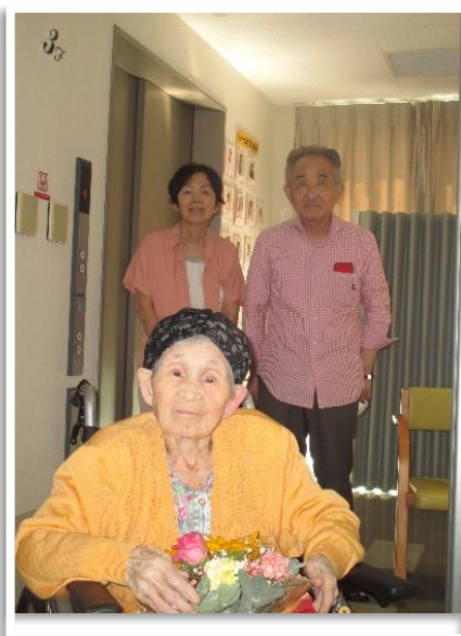
息子さん夫婦と一緒に