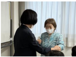
音楽に合わせてダンス♪