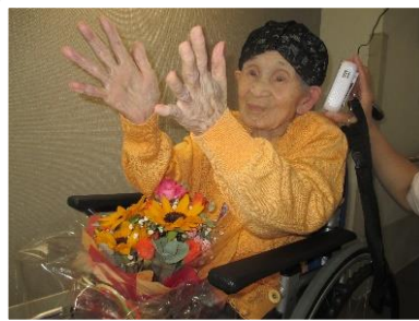
お誕生日のお祝い