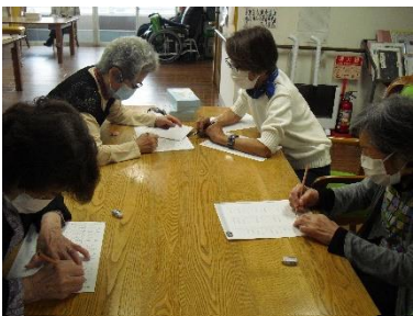
脳トレプリント「ここはどうだっけ？」