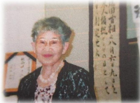
お若い頃の橋高さん