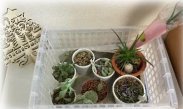
息子さんからの贈り物。すくすく成長中！