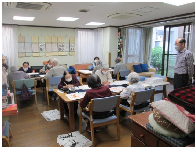
みなさん集中されています