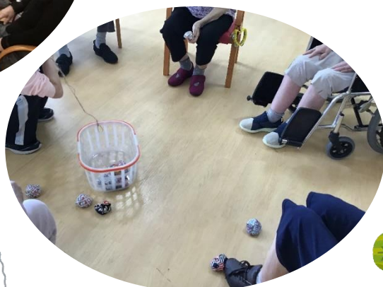
うまく入るといいな