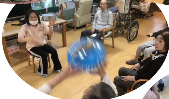
定番ですが、楽しいボール遊び ボールが速すぎ(?)で 写真がぶれてしまうくらいです