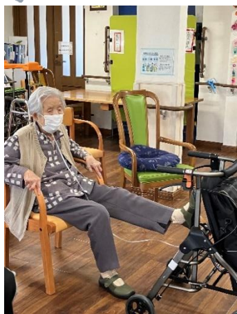
足もピンと上がるよ!