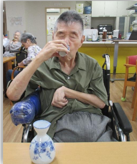
徳利とおちょこで居酒屋気分♪