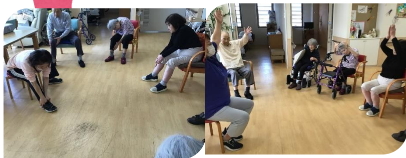
身体を伸ばして、伸ばして～ 日々、限界に挑戦中