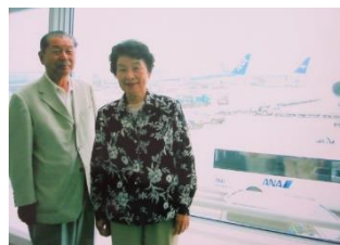
東京旅行 羽田空港