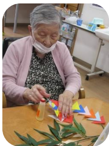
つどいの家での様子