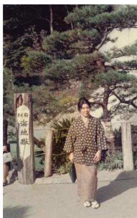
和服姿ステキですね