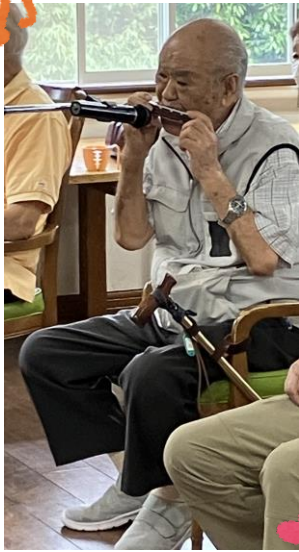
音楽療法での演奏

私がハーモニカを始めたきっかけは、戦後に本通りの楽器店でハーモニカを買って、楽器店のハーモニカバンドに入ったことから始まりました。進駐軍が宮島に駐屯しとって、そこへ慰問に行つたんですよ。そのころでは珍しく、テレビも無いところだったので、ラジオで放送されました。戦後3年くらいたつて就職してからは、ハーモニカを吹いたことはなかつたんです。発表会なんかには出たことはなかつたんですが、老人会の旅行ではあれを吹いてくれ、これをふいてくれ。と言われ忙しかつたんですよ。 今吹きよるのは、我流の我流、大我流で、楽譜はないんですよ。知ってる歌だつたら何でも吹くんですよ。鼻歌を歌うような感じで。音符は関係なしで、一応吹けます。戦後の趣味で、楽しませてもらうています。最近では誕生日や、お正月や結婚70周年の時に、子供や孫が集まって吹きましたよ。