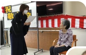
ご長寿おめでとう ございます★