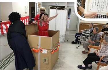
ジャジャジャーン マジック大成功