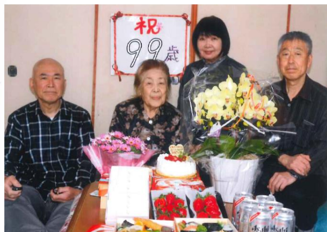
家族様と白寿のお祝い