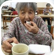
お饅頭おいしいな～