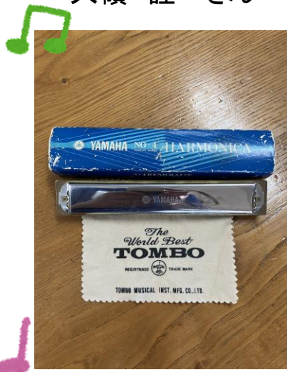
戦後から使っているハーモニカ

ふるさととか、お正月とかを吹きました。自分も楽しいし、周りの雰囲気盛り上がるんですよ。そして自分も喜ぶんですよ。これからは我流でやらせてもらいます。