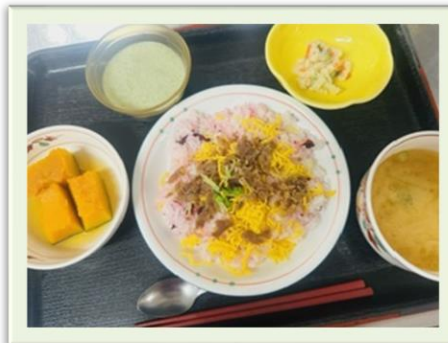
牛肉のしぐれ煮寿司