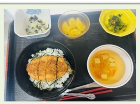
ご当地メニュー 福井県 ソースカツ丼

9月も暑い日が続いていましたが、10月に入りようやく秋らしくなってきました。9月は敬老の日、秋分の日とイベントが続きました。散らし寿司や天ぷら・赤飯など普段とは少し違う食事で季節を感じていただけたでしょうか。食欲の秋です！しっかり食べて元気に過ごしましょう！