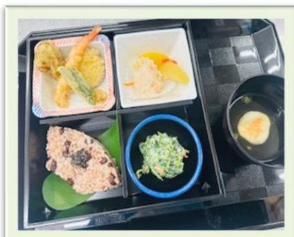
9/11 しゅりあちよーく 感謝祭メニュー