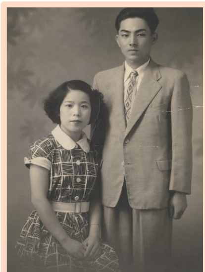
初めてご主人と一緒に撮った写真(結婚する前)