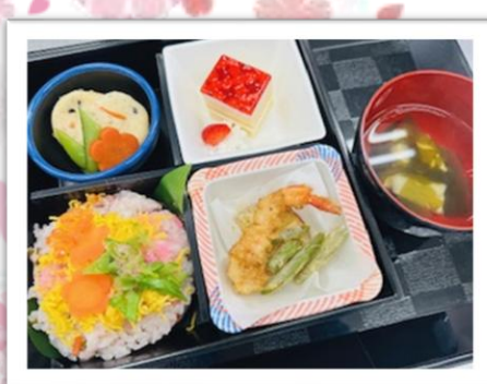
しゅりあちょーく