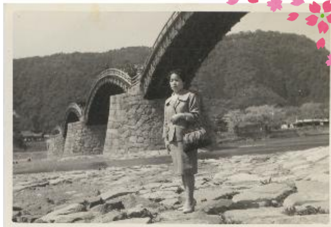
独身のころ 友人と錦帯橋へ(19歳)