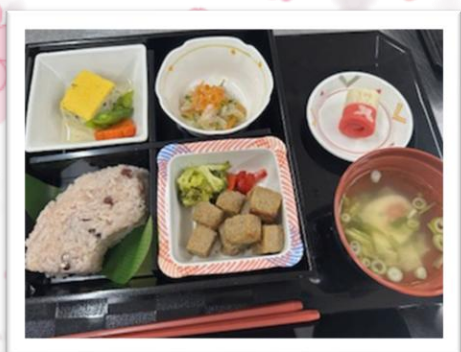
まやるちょーく大町